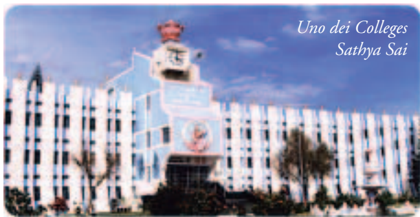
Uno dei Colleges Sathya Sai

Abbandonate l'ego, e tutti i problemi svaniranno.”