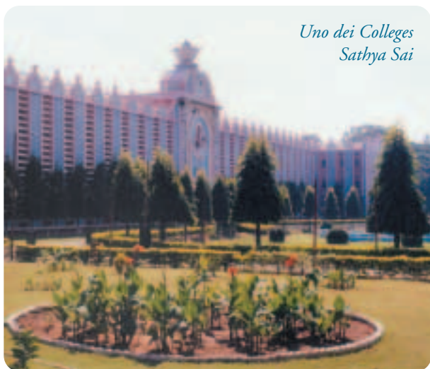
Uno dei Colleges Sathya Sai

Ha fondato sistemi educativi scolastici a tutti i livelli; da quello elementare a quello universitario, completamente gratuiti, dove il massimo sviluppo dei programmi statali è conseguito basandosi sui Valori Umani: Verità, Rettitudine, Pace, Amore e Non-Violenza. L'insegnamento di questi Valori fa sì che lo studente s'inserisca nel tessuto sociale vivendo questi Principi. Il lavoro, quindi, non viene considerato solo come mezzo per acquisire denaro e beni materiali, ma come strumento per servire al meglio l'uomo e la società. I laureati delle Università di Sai Baba vengono richiesti in tutto il mondo poiché, oltre ad un'eccellente preparazione scolastica, l'integrità della loro vita rappresenta una prestigiosa garanzia di correttezza e professionalità.