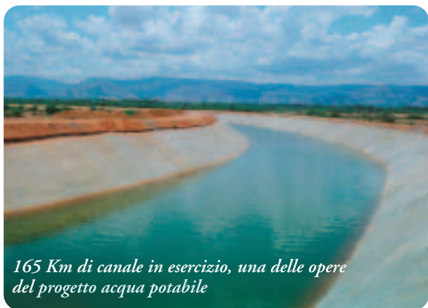
165 Km di canale in esercizio, una delle opere del progetto acqua potabile

Per due milioni di persone dello stato di Andhra Pradesh, nel sud dell'India, l'approvvigionamento di acqua potabile è sempre stato un problema quotidiano. Non solo, anche la purezza dell'acqua non era garantita e in tanti casi era disponibile solo acqua inquinata. Dopo aver sollecitato invano il Governo affinché affrontasse il grave problema dell'acqua potabile, Sai Baba ha inaugurato diversi progetti di grande entità e con una realizzazione molto rapida. Questi progetti hanno potuto fornire a milioni di persone e oltre 1000 villaggi acqua potabile pulita: nel 1994 progetto nel distretto di Anantapur, nel 2001 a Medak e Mahabubnagar e nel 2004 a Chennai. È stato avviato un ulteriore progetto a East-Godvari nel 2007.